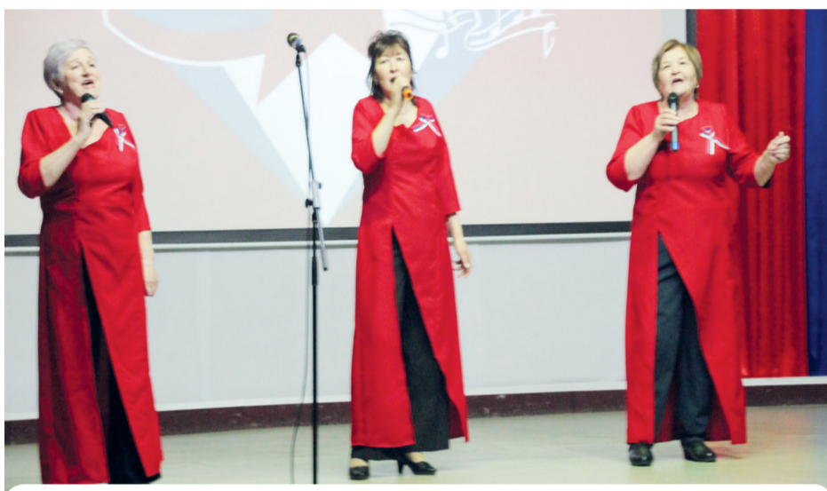
Группа «Лето», как всегда, была на высоте