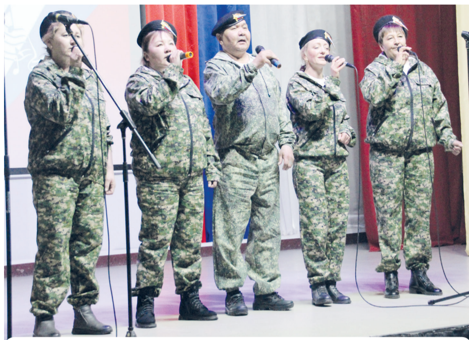
Костюмы группы «Жемчужина» - под стать её песне