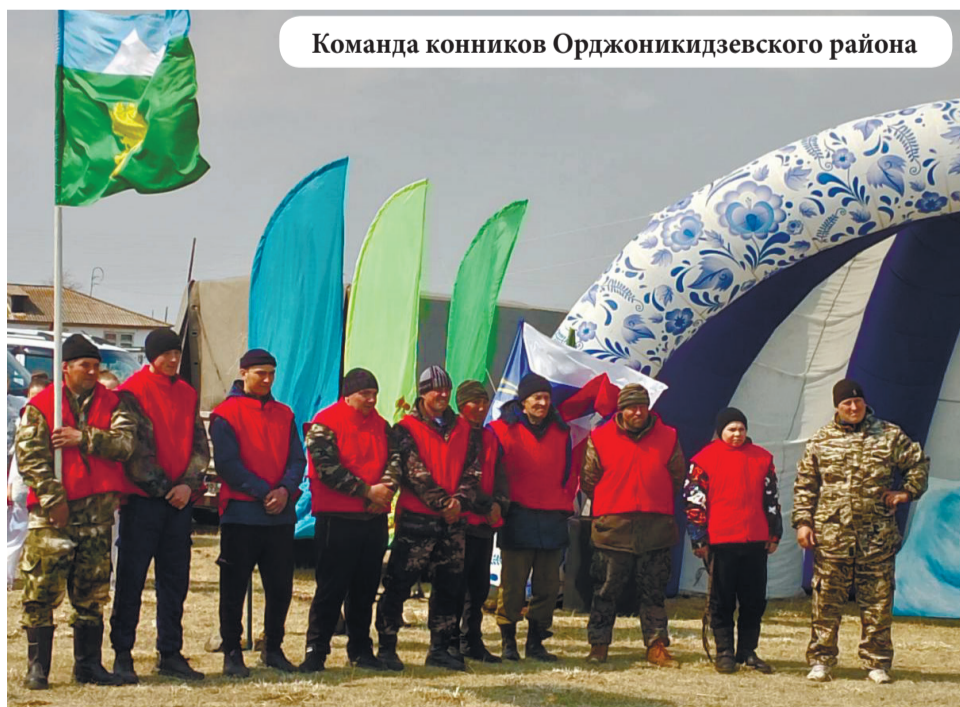
Команда конников Орджоникидзевского района