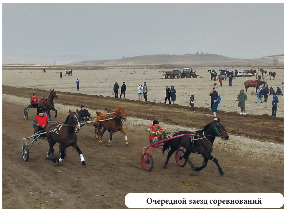
Очередной заезд соревнований