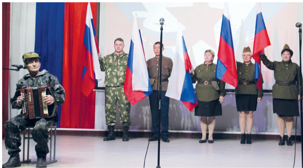
Самое активное участие в конкурсе приняли июсцы