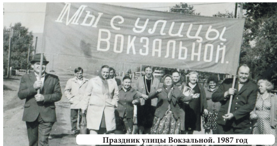
Праздник улицы Вокзальной. 1987 год

матривали приусадебные участки любителей-цветоводов и садоводов. А в Копьево их очень много. Они охотно предоставляли выращенные дары и цветы в свои организации для выставки. Посетители