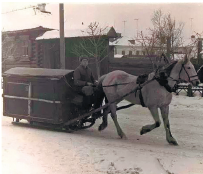
Так развозили хлеб в магазины. 1965 г.