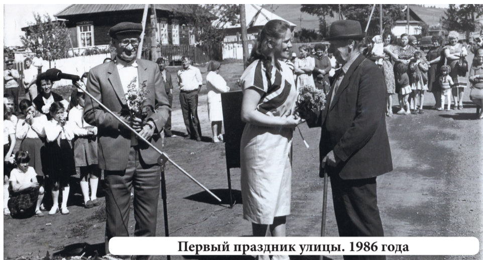
Первый праздник улицы. 1986 года