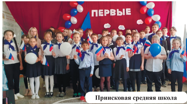
Присковая средняя школа