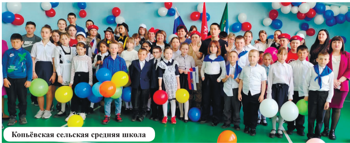
Копьёвская сельская средняя школа