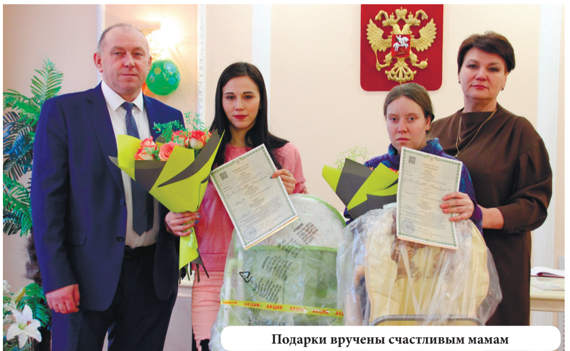
Подарки вручены счастливым мамам