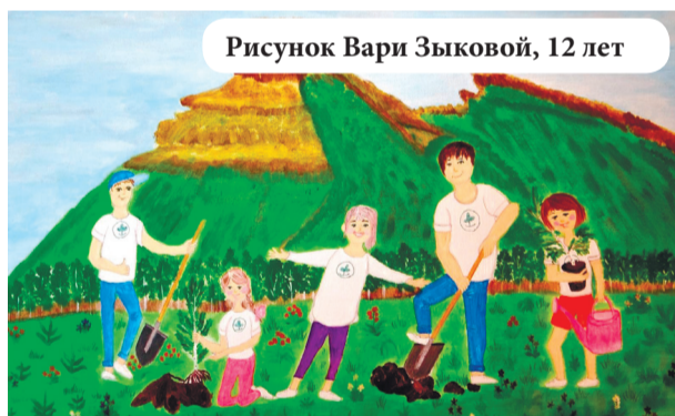
Рисунок Вари Зыковой, 12 лет

В этом лишний раз убеждаешься, глядя на работы воспитанников студии «Мир и человек», подготовленные