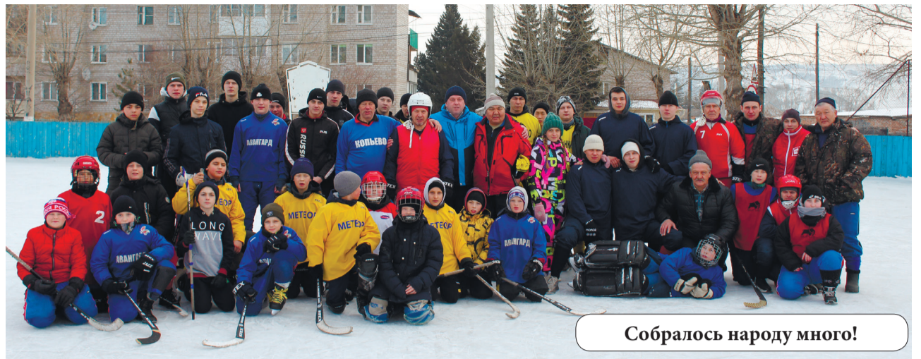
Собралось народу много!

Вообще, в хоккейном сезоне 2022-23 гг. устинкинцы по количеству выездных матчей, уровню игры и забитым мя-