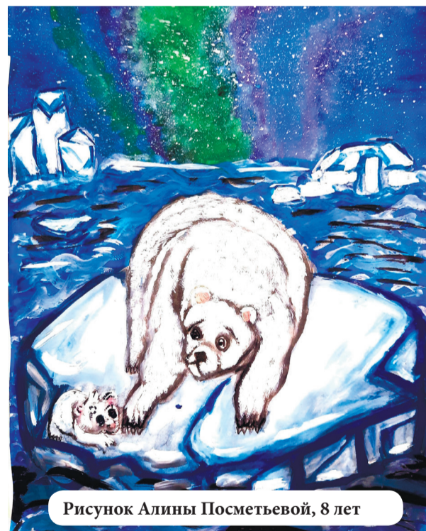
Рисунок Алины Посметьевой, 8 лет

лесных экосистем); «Домашние питомцы» (рисунки, изображающие домашних животных); «Заповедные уголки родного края» (рисунки, посвящённые особо охраняемым природным территориям); «Родные пейзажи» (рисунки, основным предметом изображения которых является первозданная либо в той или иной степени преобразённая человеком природа, рисунки, отражающие красоту родной природы); «Охраняемые растения и животные» (рисунки, изображающие растения и животных, занесённых в Красную книгу); «Зелёное будущее планеты» (рисунки, отражающие возможное будущее планеты и цивилизации, размышление о позитивных вариантах развития); «Здоровье нашей планеты – в наших руках» (рисунки, изображающие реальные и возможные профессии будущего,