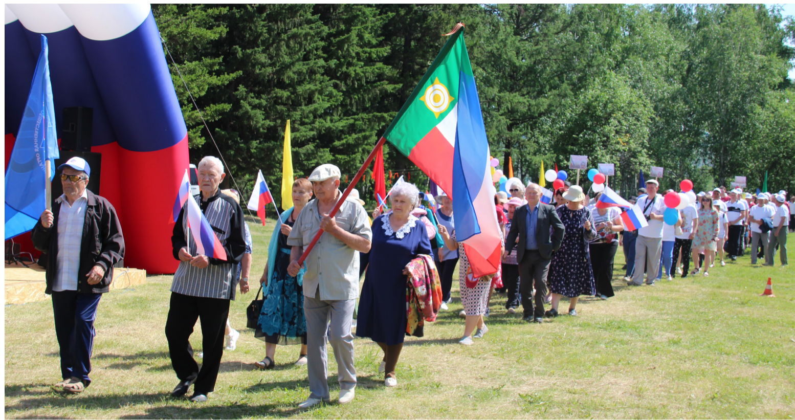
В едином строю - трудовые коллективы и ветераны посёлка