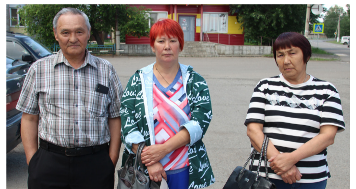
Ждёт Севастополь, ждёт Камчатка, ждёт Кронштадт. В Копьёво, Конгарово, Устинкино... верят и ждут родные своих ребят.