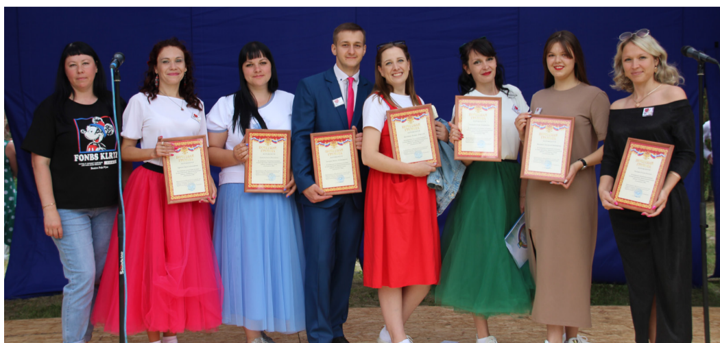
и талантливой молодёжи