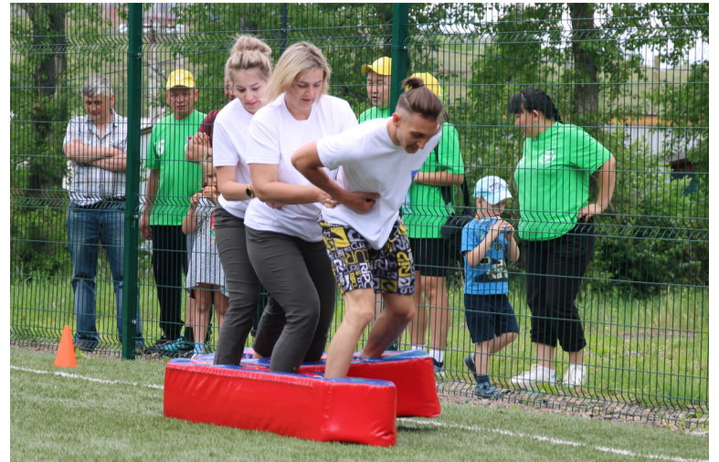
В «лыжах» по траве

Первой вышла на круг команда Копьёвского Дома детского творчества. Начальный этап – «прыгобег» в мешках: пара игроков должна была быстро достичь второй «двойки», касание – и те пошагали в надувных вёдрах к воротам, а здесь уже все вместе, шестером, ухватились за тяжёлый брус, с которым надо было 10 раз присесть и встать. Далее упражнение на ловкость и координацию: ноги в лыжи (пластиковые) – и пошагали по траве. Кто-то начинал ход не с той ноги, упали – встали, лучше всего здесьгодились навыки байдарочников. Вокруг хохот, свист и подбадривающие крики болельщиков. Зрителей, привлечённых