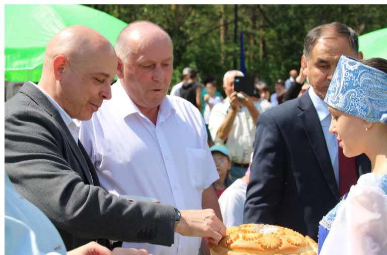
Хлеб-соль почётным гостям