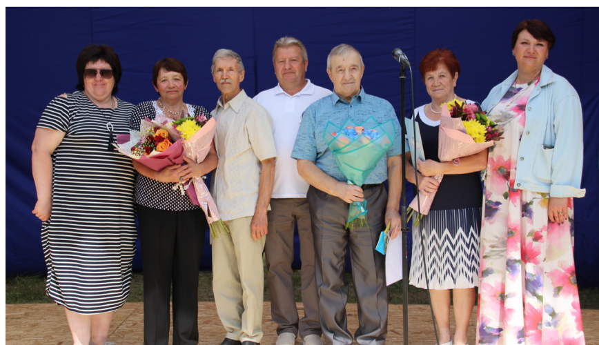
Чествование «золотых» юбиляров

Копьёвцы и гости посёлка говорят спасибо за подаренный чудесный праздник!