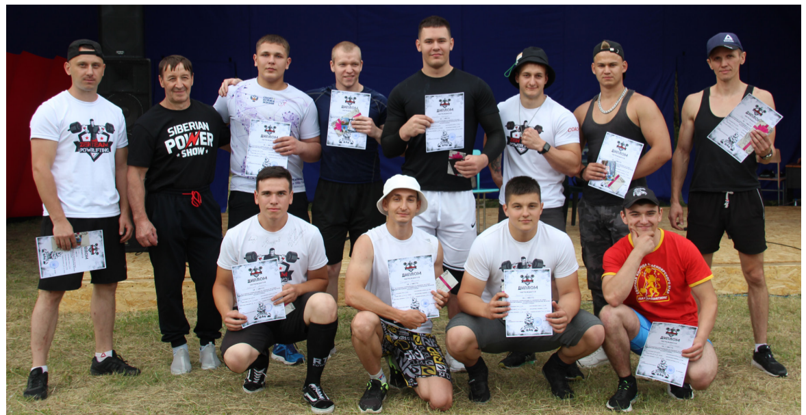
«Медведи» - силачи