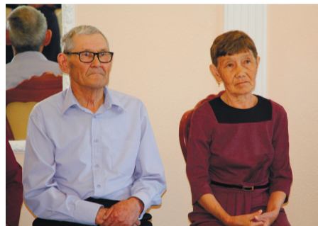
Емандыковы вместе уже 55 лет!