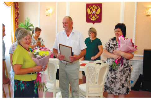
Цветы, подарки, поздравления как дань любви и уважения