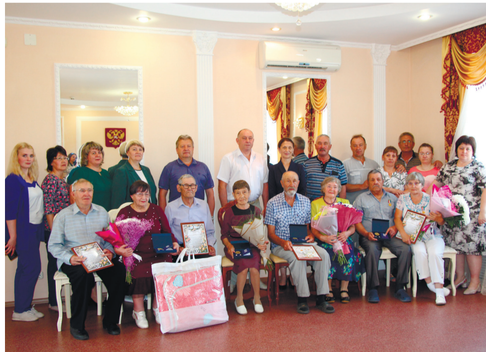
Большое торжество – «изумруд» и «золото» семейного стажа