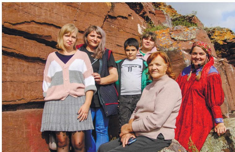
На Вечной скале

Замечу, что я приехал ещё долго до начала экскурсии, чтобы обозреть окрестности, да только лучше всего это получилось в ходе экскурсии сверху, с горы: отсюда открываются прекрасные виды.