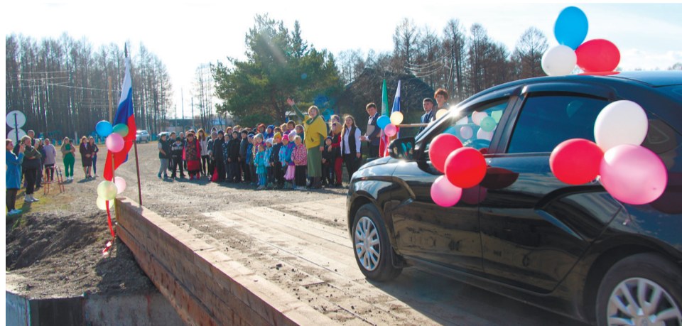
Мост через речку Рачжуй открыт

И мы победили, заняв 1-е место в Хакасии. У нас уже есть опыт такой работы: в 2021 году Гайдаровский сельсовет также побеждал в данном конкурсе с проектом строительства детской площадки. Спасибо Правительству нашей республики в лице Главы Валентина Олеговича Коновалова, что с каждым годом увеличивают призовой фонд конкурса (если в 2021 г. получили грант за 1-е место в сумме 550 тысяч рублей, то нынче уже