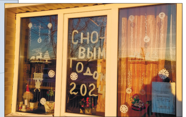
С Новым годом поздравляет Центр хакасской национальной культуры «Тамырлар» (Корни)