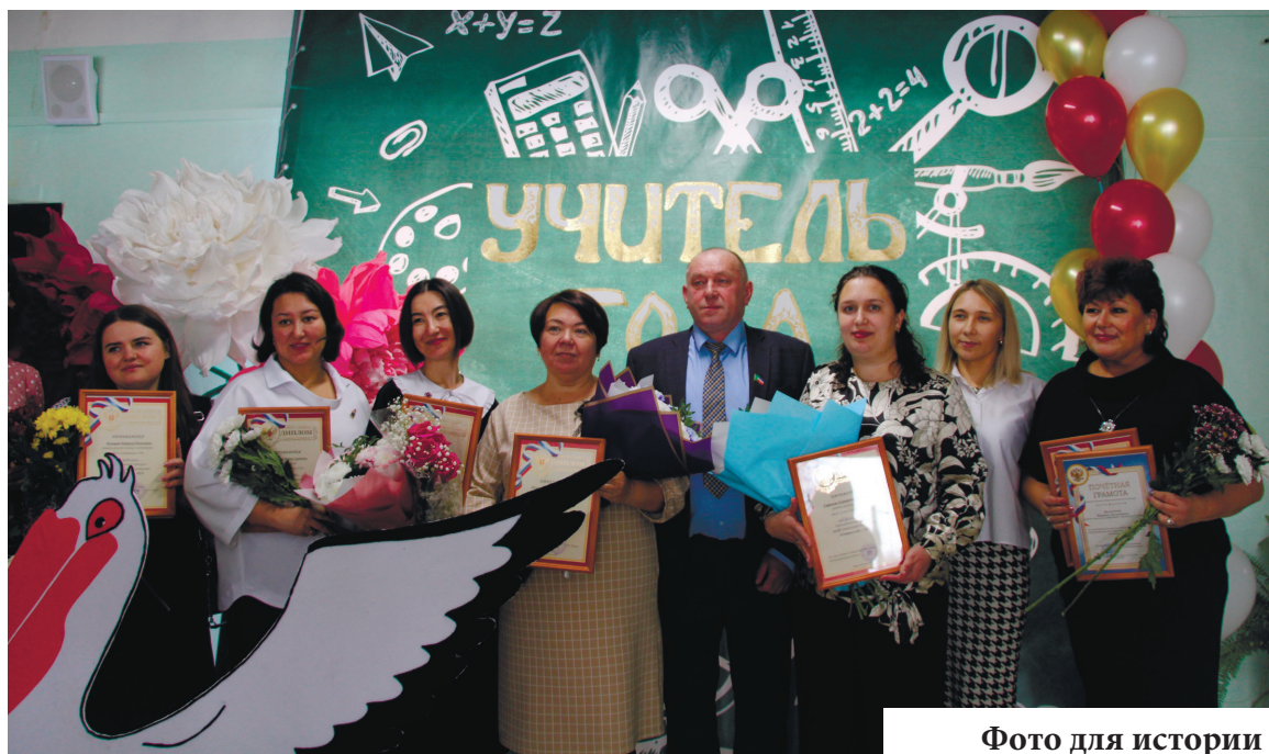
Фото для истории

новных тенденций развития современного школьного образования, свою профессиональную и гражданскую позицию в определении и решении актуальных проблем российского образования, мастерство общения с аудиторией, умение вести профессиональный диалог с педагогами, представляя свой педагогический опыт.