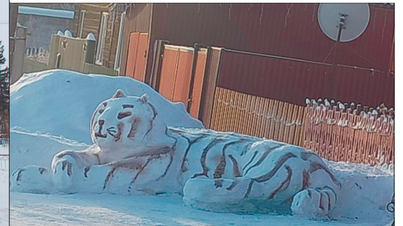
Жители Копьёво украшают посёлок не только разноцветными гирляндами