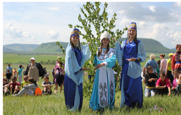
Детский Тун Пайрам (2014 г.)