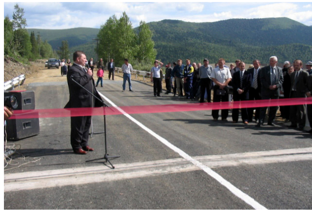
Торжественное открытие моста через реку Сарала (2004 г.)