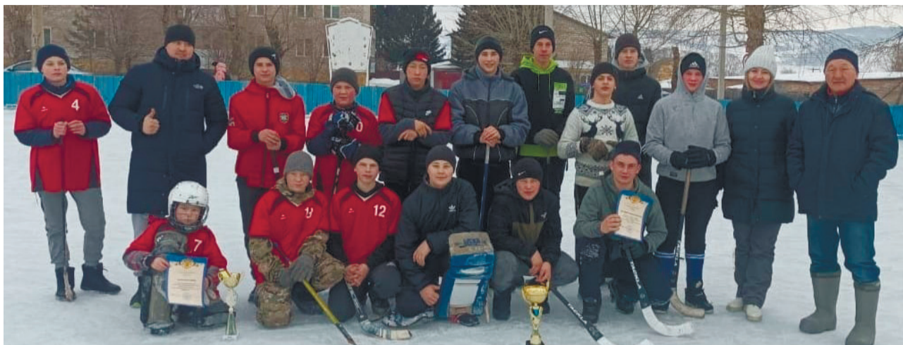
Награждение команд – участников турнира

В Рождественский сочельник 6 января на ледовом поле хоккейной коробки п. Копьёво состоялся турнир по хоккею с мячом на валенках.