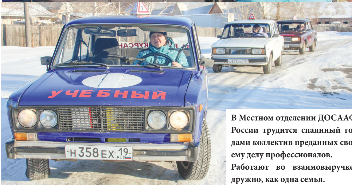
В Местном отделении ДОСААФ России трудится спаянный годами коллектив преданных своему делу профессионалов. Работают во взаимовыручке, дружно, как одна семья.

тельные материалы на месте не стоят, но если не стонать на эту тему, сидя ровно на стуле, а частями делать, то продвижение вперёд реально.