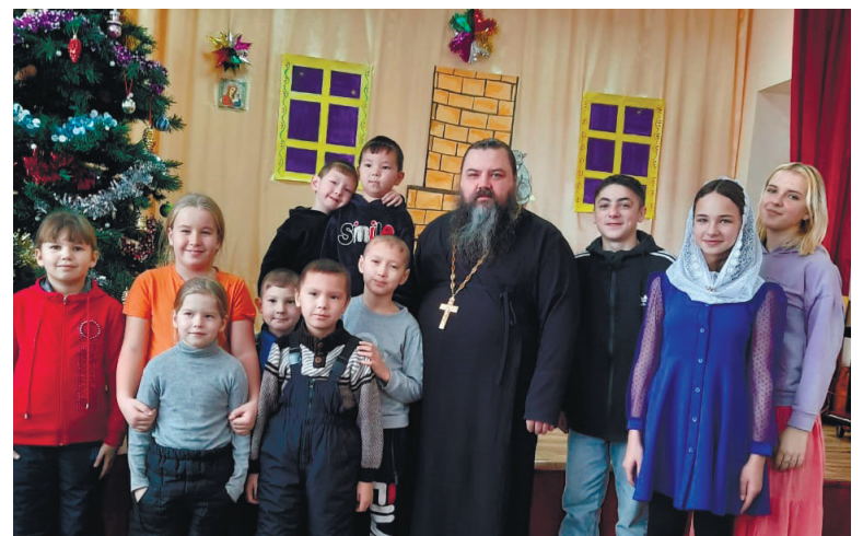
На спектакле в Кагаево

ехали в Кагаево, где на сцене маленького деревенского клуба показали свою постановку детского рождественского спектакля «Морозко». А ещё дети из Копьёво и Кагаево читали стихи и пели песни, получая подарки от Деда Мороза и Снегурочки.