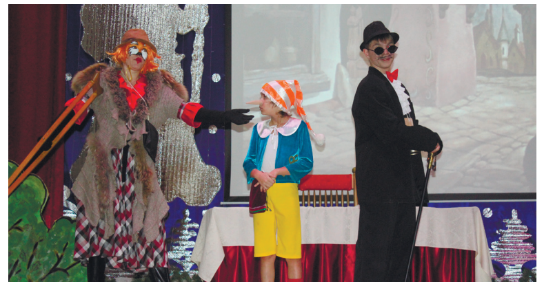
Подайте бедному слепому коту Базилио и хромой лисе Алисе!