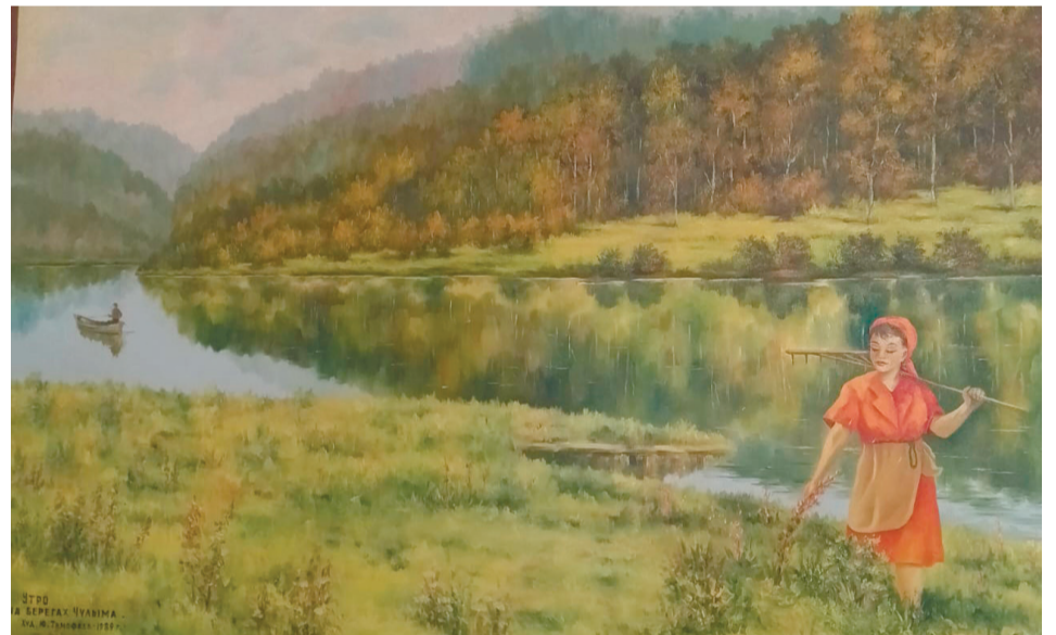
Утро на берегах Чулыма. 1989 г.