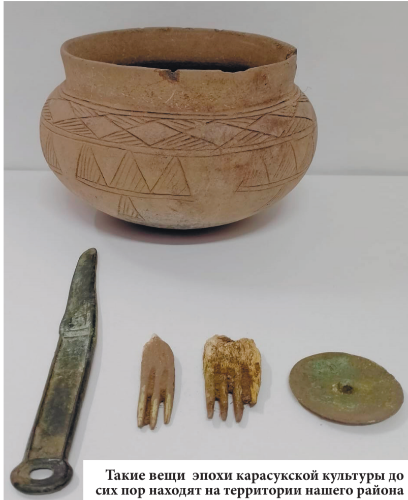
Такие вещи эпохи карасукской культуры до сих пор находят на территории нашего района

- Анклав распространения карасукской культуры довольно широк – от Казахстана до Южной Сибири. В местах компакт-