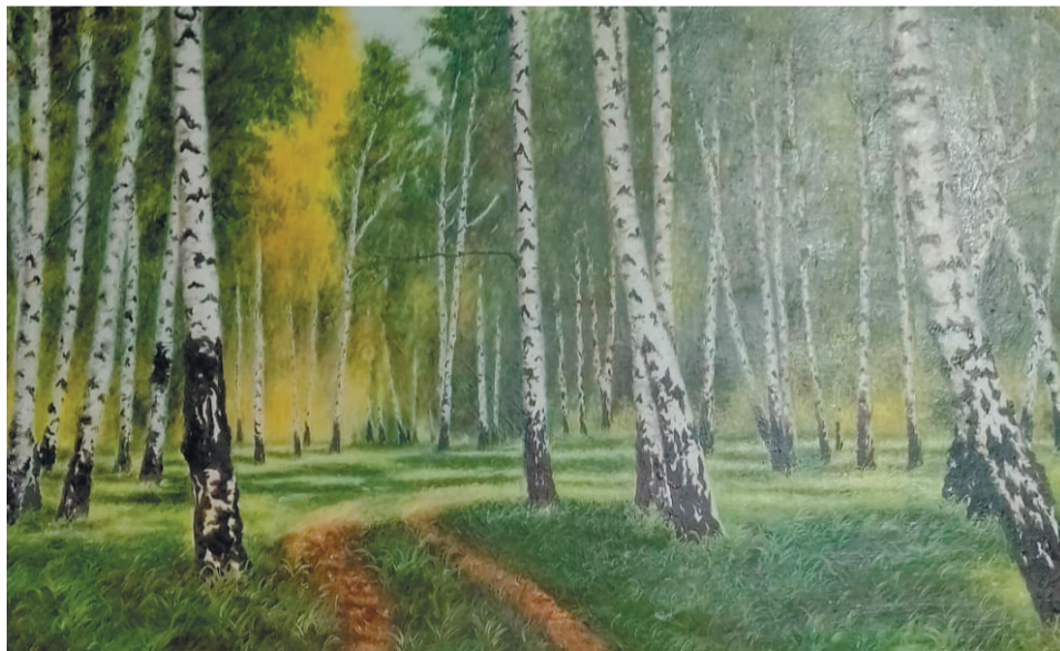
Берёзовый лес. 1958 г.