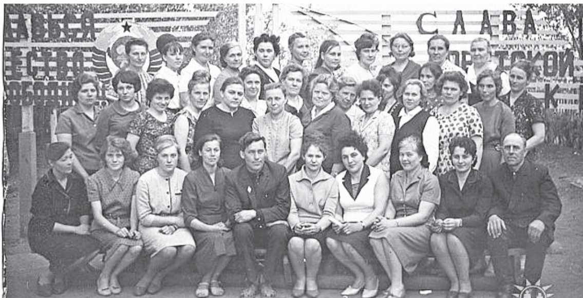
Учителя Копьёвской средней школы. 60-70-е годы XX века

О преподавании физкультуры. Старшее поколение пом-