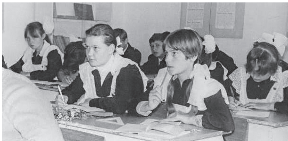
Школа нашего детства.