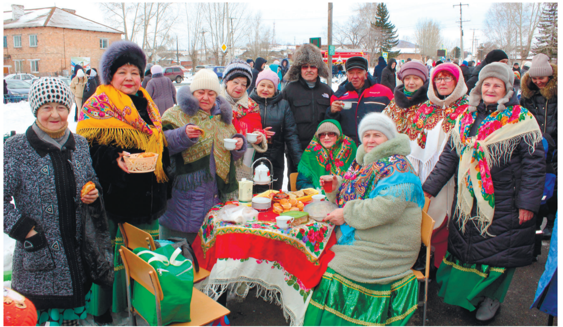
Гуляния и торги