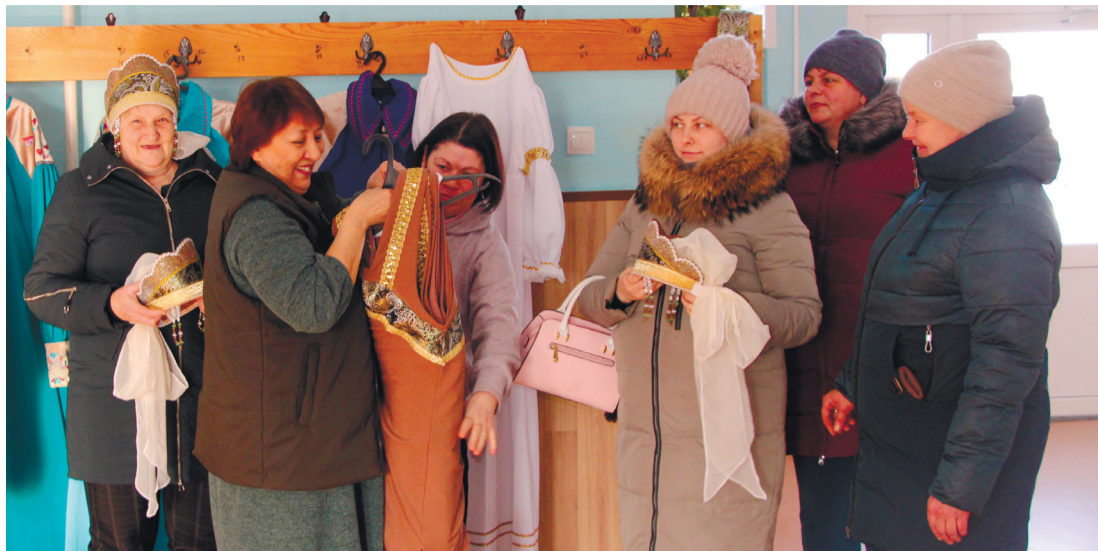
Всё начинается сначала - весне одежды примерять

Внутри тепло и уютно. В большом фойе много цветущих многолетников, картины и фотографии на стенах, привлекает внимание стол для бильярда. Слева и направо по коридорам – кабинеты для занятий, раздевалки. Прямо от входных дверей – достаточно вместительный по сельским меркам зрительный зал и сцена для выступлений.