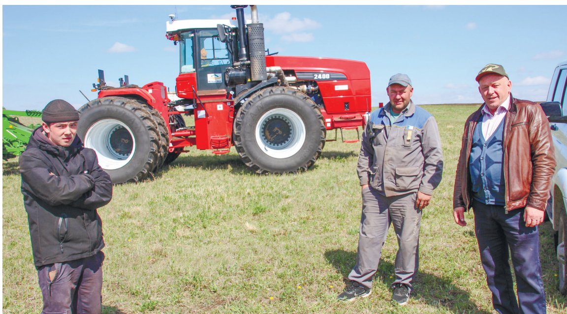
На фоне мощных тракторов: ещё минута и взревет моторы

- Сам захотел, - отвечает он. - Работаю уже три недели.