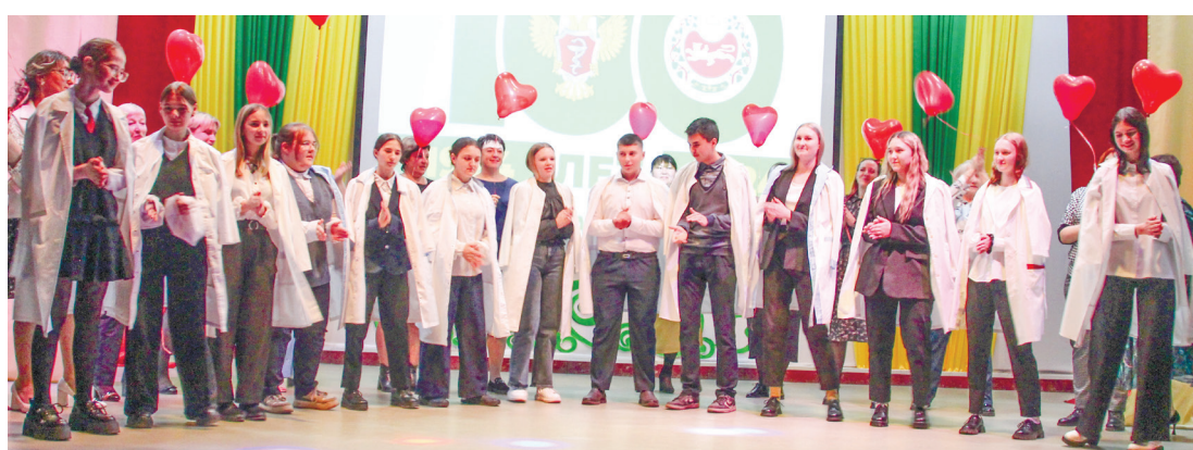
Будущее медицины – медкласс Копьёвской средней школы