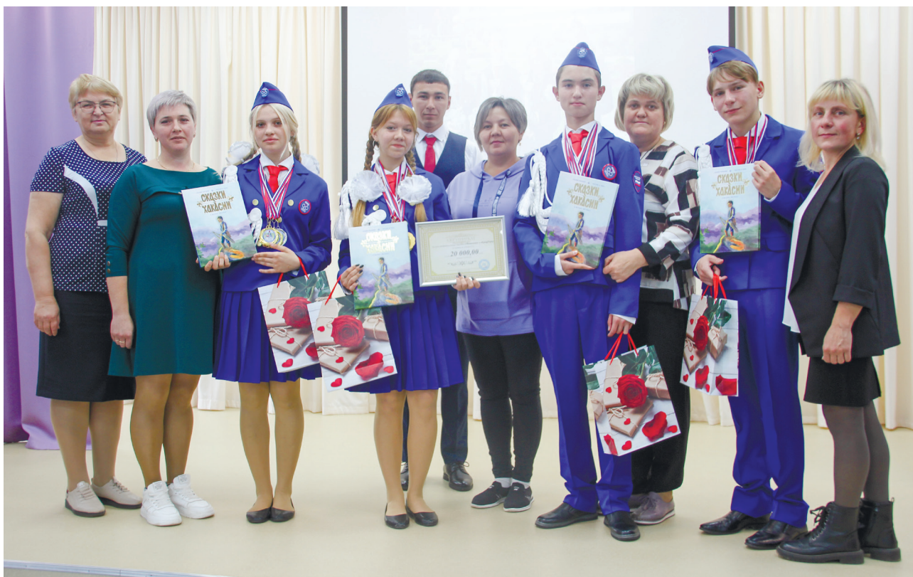
Юные победители со своими наставниками и родителями

А 25 сентября в актовом зале Устино-Копьёв-