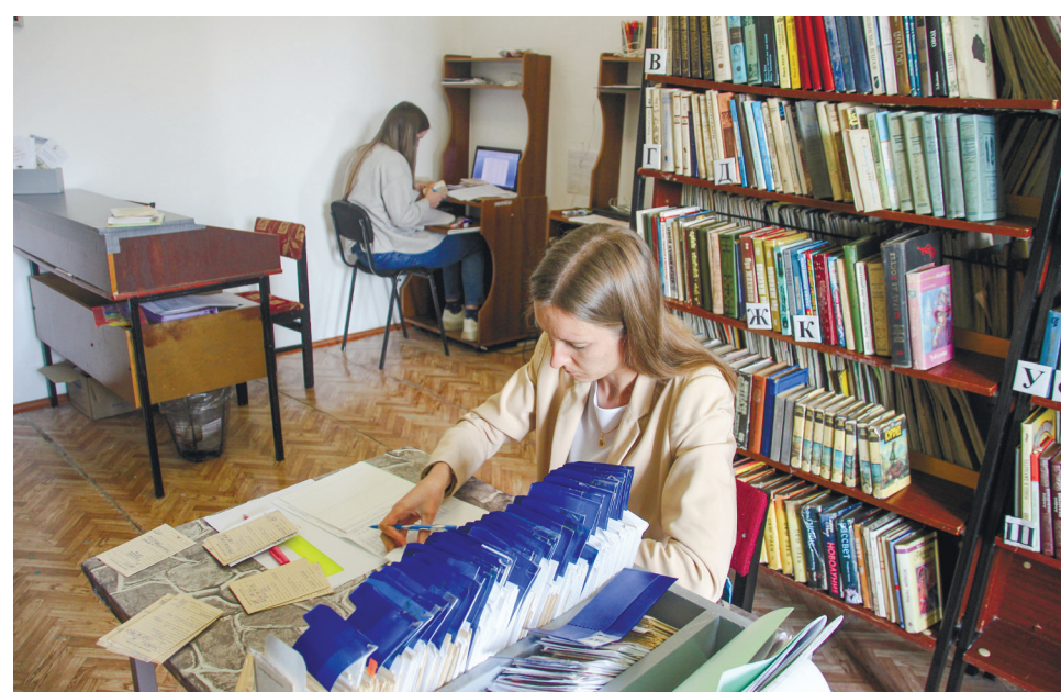
Библиотека вернулась в рабочее русло

Благодаря десяток лет назад сделанным администрацией района вложениям в здание тогда ещё инфо (замена котла и системы отопления, установка современных окон), сейчас хоть на это не надо изыскивать средства. В минувшем году отремонтировали санузел. Да, хотелось бы облагородить здание снаружи, ведь штукатурка недолговечна. Но обшивка металлопрофилем, с учётом всей необходимой фурнитуры, влетит не в один мил-