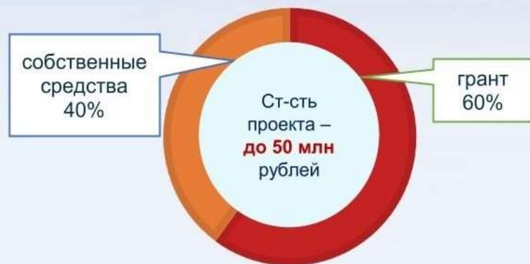
«классическая» схема финансирования стоимости проекта

30 млн рублей – на все виды деятельности