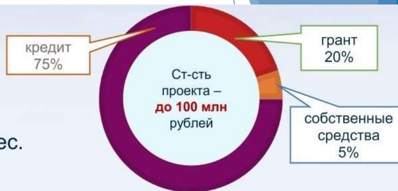
схема финансирования стоимости проекта, реализуемого с участием льготного инвестиционного кредита

! Максимальная вместимость проектов животноводческих ферм – 400 голов маточного КРС, 500 усл.голов маточного МРС