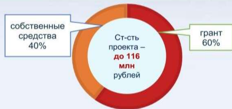
«классическая» схема финансирования стоимости проекта

70 млн рублей – на приобретение производственных объектов, оборудования, спецтехники и транспорта, мощностей для хранения продукции, торговых объектов