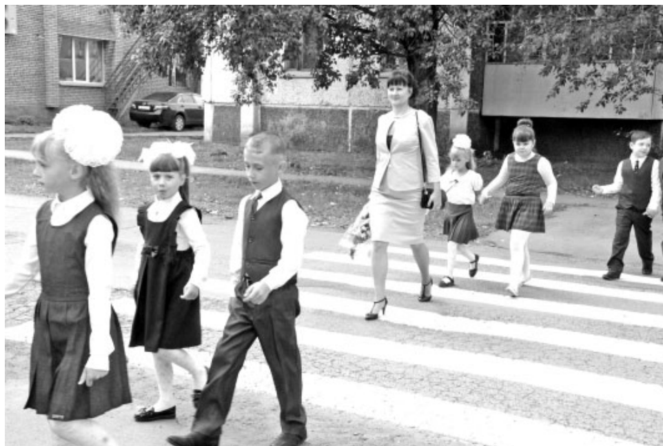
Наиболее безопасный способ передвижения по населённому пункту – «шагающий автобус», или «паровозик». Так ходят организованные группы школьников

щено передвигаться по проезжей части, кататься на велосипедах им можно только по пешеходным зонам. И только тем, кто старше, можно пользоваться автодорогой, опять же при условии, что тротуары отсутствуют и что двигаются они по направлению автомобильного потока. Но