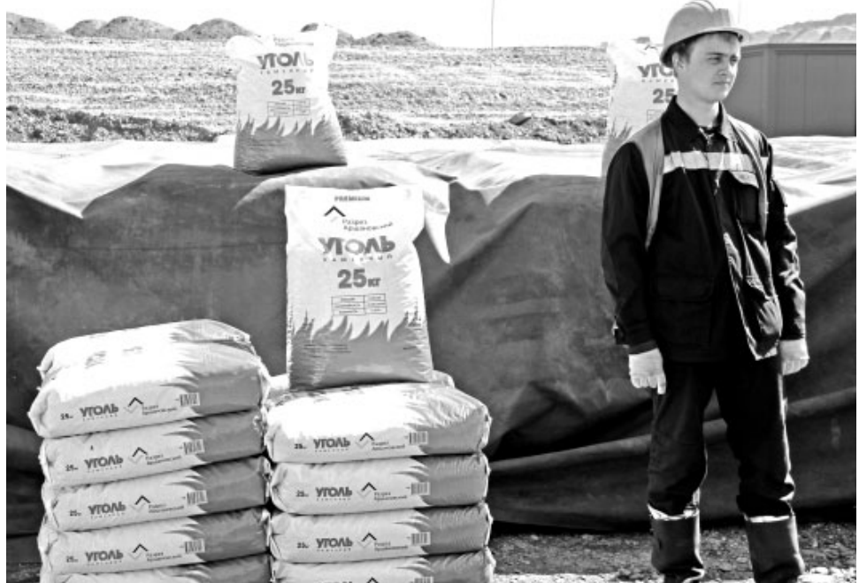
Уголь фасуется под заказ, отправляется в европейскую часть страны и за рубеж

Уголь фасуется под заказ, отправляется в европейскую часть страны и за рубеж. В нашей республике реализация упакованного топлива пока в начальной стадии. Но есть уверенность: люди непременно оценят уголь в пакетах за высокое качество, удобство в транспортировке, переноске и использовании и, конечно же, чистоту в котельных и помещениях для хранения.