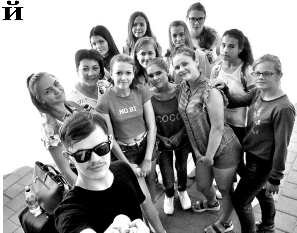
Участники международной детской деревни на Алтае из Орджоникидзевского района

- За эти 10 дней мы сплотились и стали настоящей дружной семьёй. Мы много общались и веселились, хотя график был очень плотный и все уставали под конец дня. Запомнилось много ярких моментов, в том числе работа замечательных школ. Так, в школе вожатского мастерства я узнала, что вожатый - не просто профессия или хобби. Это призвание, за смену вожатый заменяет детям маму и папу. Вожатые - это профессионалы своего дела. И хотя они ещё студенты, но уже знают подход к детям: ради нас не спят сутками, готовы увлекательные мероприятия и игры.